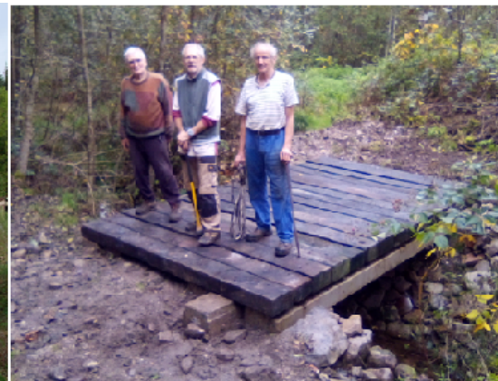
Pont de la tréfilerie et sa construction