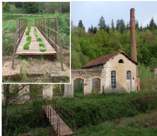
Passerelle du "Clou-Atre"

Je laisse la parole aux membres du conseil coopératif et du comité d'éthique et je vous souhaite une excellente année 2023, en espérant vous retrouver pour notre AG festive le samedi 10 juin.